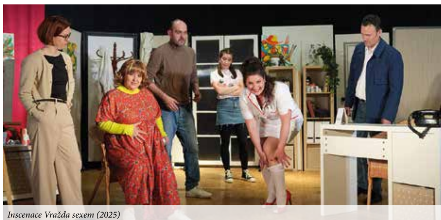
Inscenace Vražda sexem (2025)