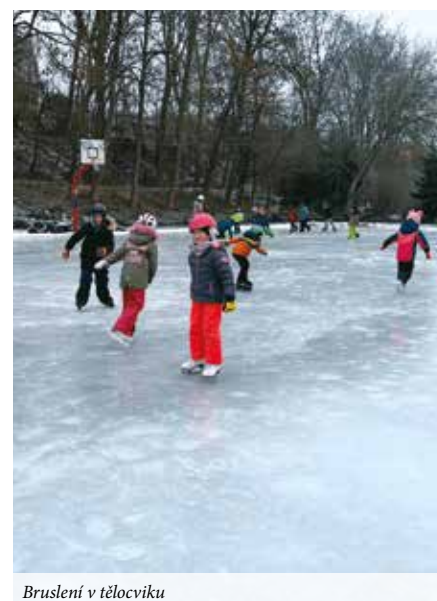
Bruslení v tělocviku