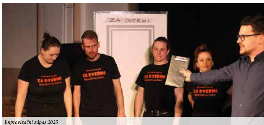
Improvizací zápas 2025