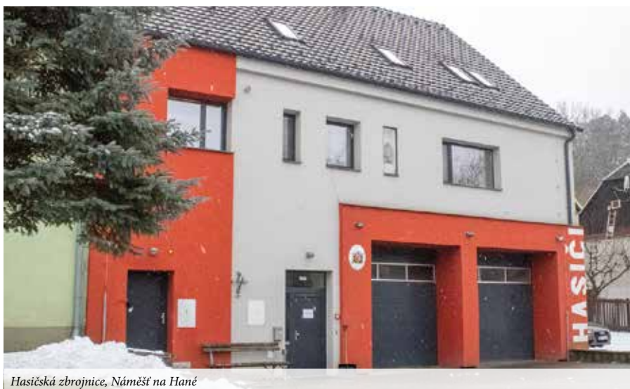
Hasičská zbrojnice, Náměšť na Hané