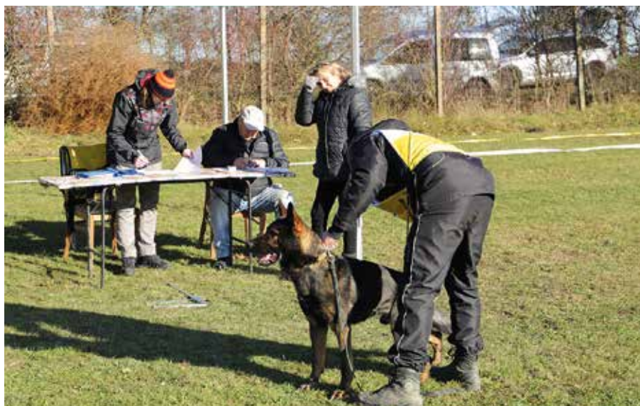
Bonitace německých ovčáků – posouzení exteriéru rozhodčím