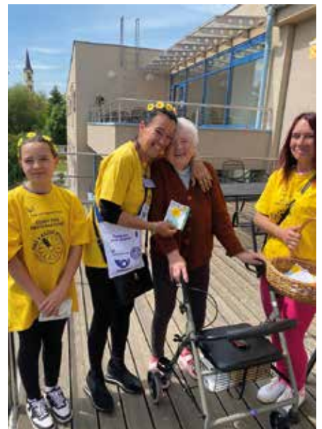
Den proti rakovině