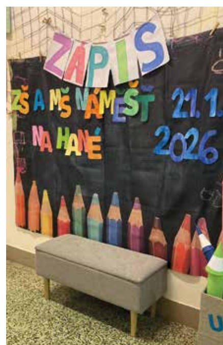
Zápis do 1.třídy

Školní sbor zároveň potěšil klienty Domova seniorů František, který zpěvem adventních písní, básničkami a drobnými dárky.