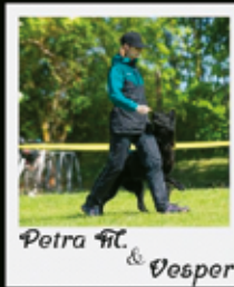
Petra 9C & Vesper