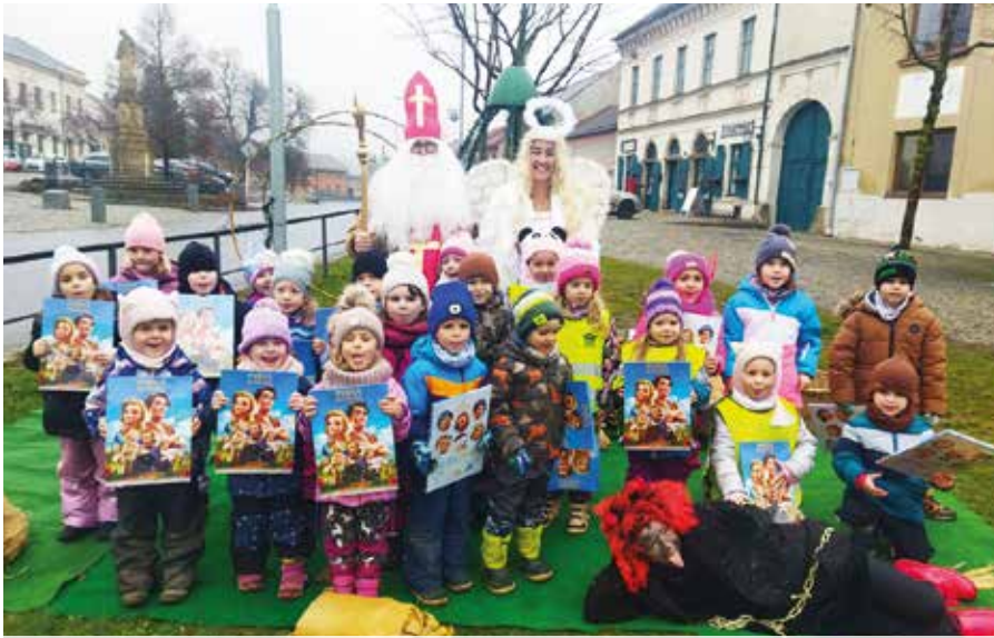
Mikuláš pro MŠ a ZŠ