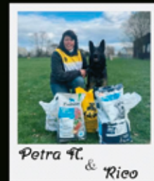
Petra 9C & Rieco