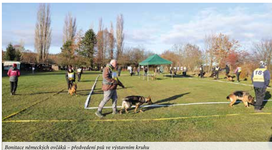
Bonitace německých ovčáků – předvedení psů ve výstavním kruhu