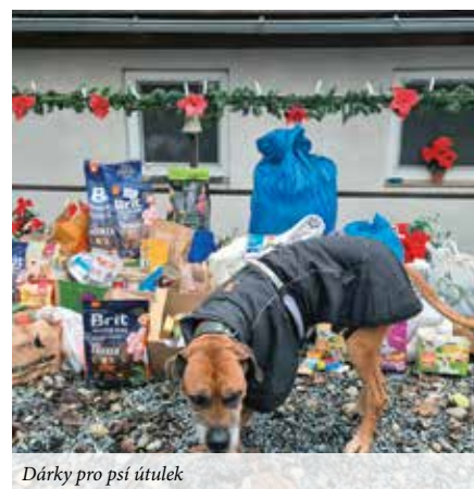
Dárky pro psí útulek