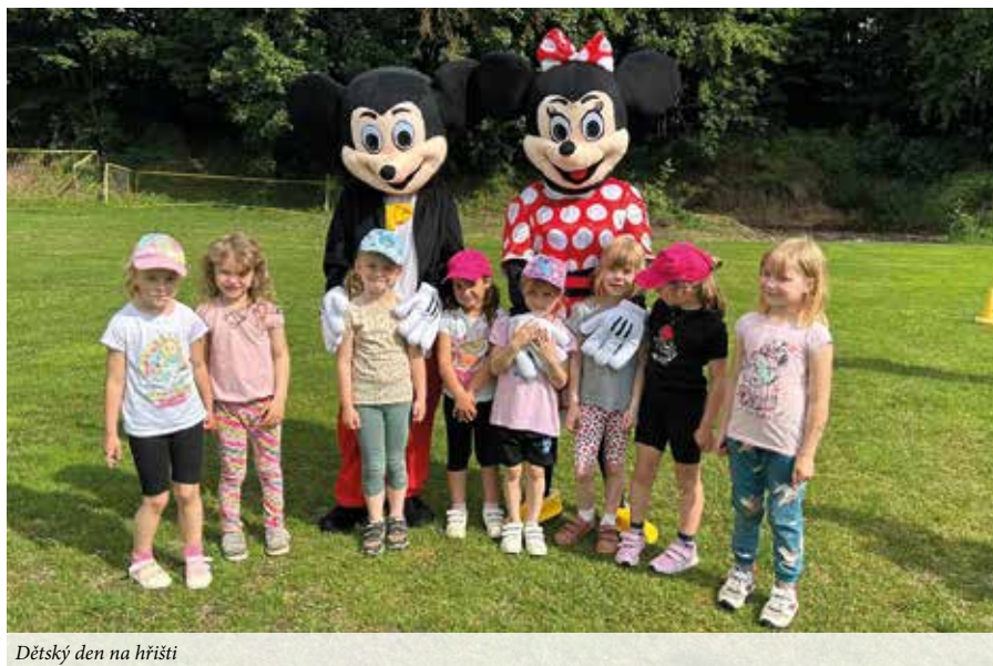
Dětský den na hřišti