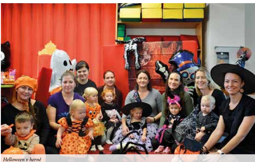
Halloween v herně