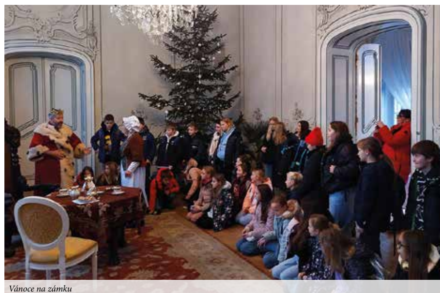
Vánoce na zámku