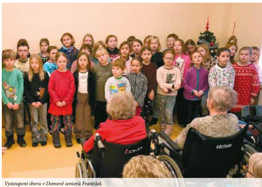
Vystoupení sboru v Domově seniorů František