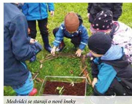
Medvídci se starají o nové šneky