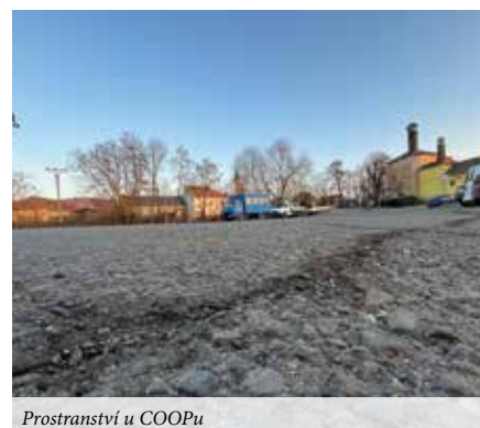
Prostranství u COOPu