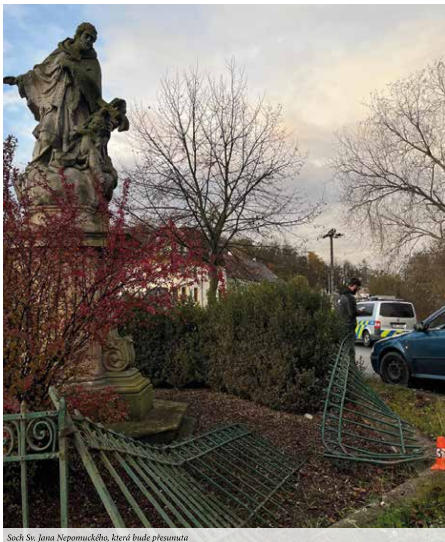
Socha Sv. Jana Nepomuckého, která bude přesunuta