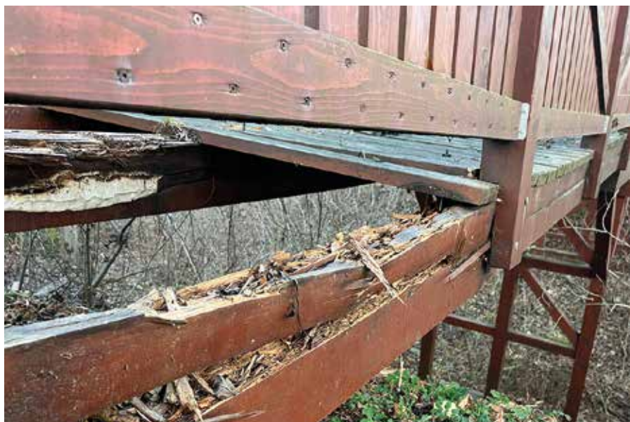
Havarijní stav mostu

„Stávající most u hradu stojí pouhých deset let. Jsme přesvědčeni, že nebyl vyrobený z vhodného dřeva.