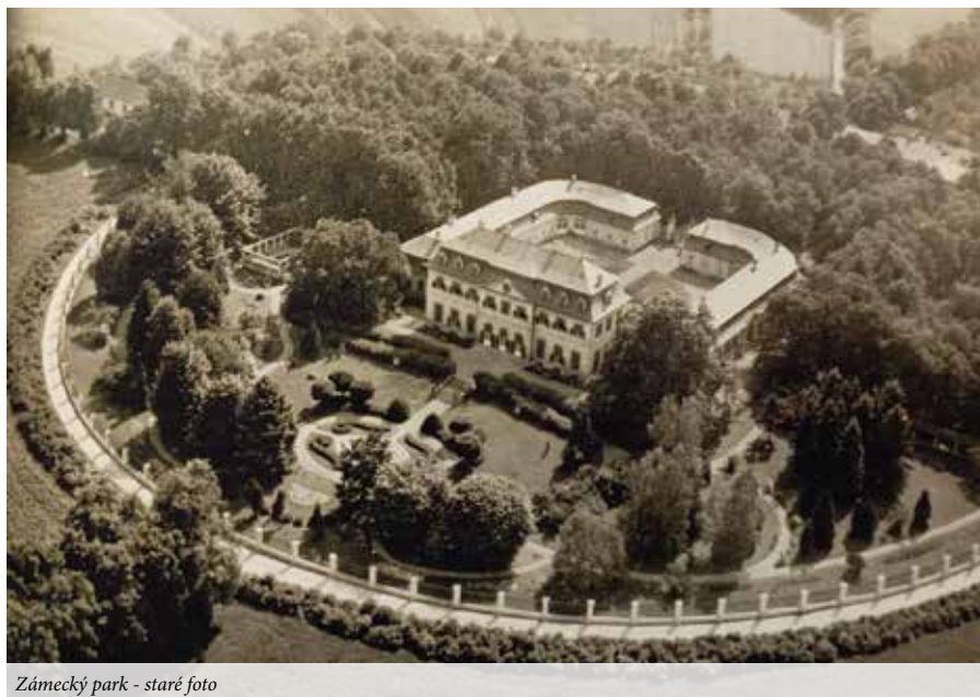
Zámecký park - staré foto