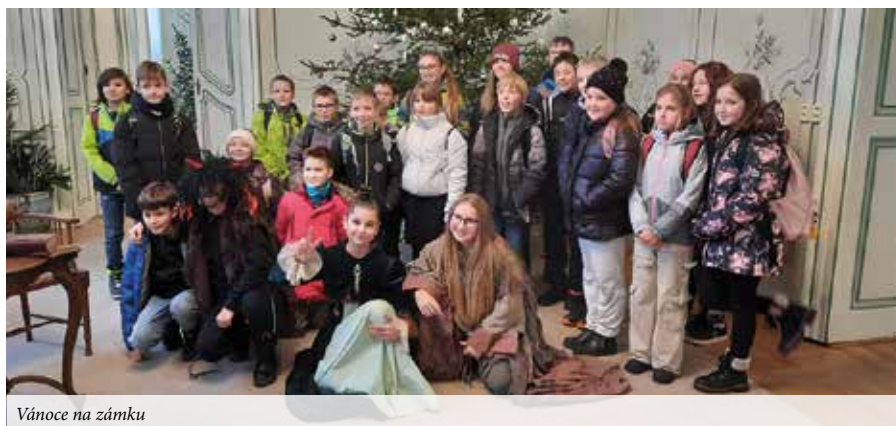
Vánoce na zámku