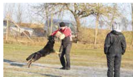
Tréning obran – J. Lakomá a Barunka z Ratibořic, údolí