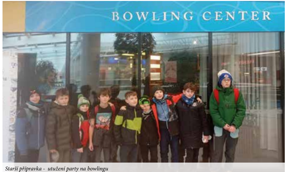
Starší příprava - utužení party na bowlingu