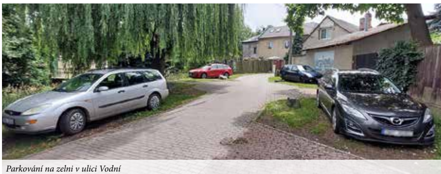
Parkování na zeleni v ulici Vodní