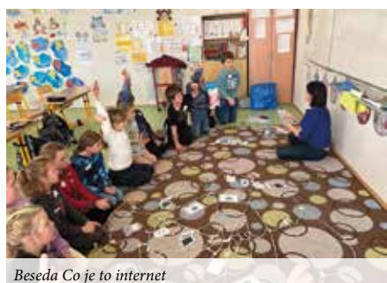
Beseda Co je to internet

V tomtéž období se žáci třetí třídy zúčastnili projektového dne na téma "Co je to internet a jak ho bezpečně využívat". Prostřednictvím interaktivních her a prožitkových aktivit se seznámili s výhodami i riziky online prostředí. V dnešní době, kdy sociální sítě a internet hrají v životech dětí velkou roli, byl tento projekt bezpochyby cennou zkušeností.