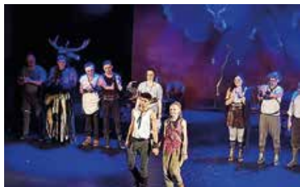
Divadlo Prostějov - Ronja, dcera loupežníka