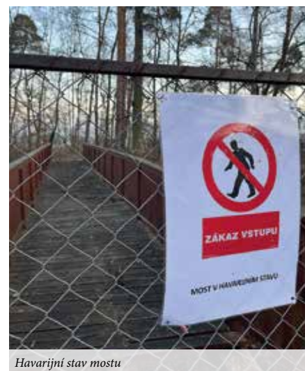
Havarijní stav mostu