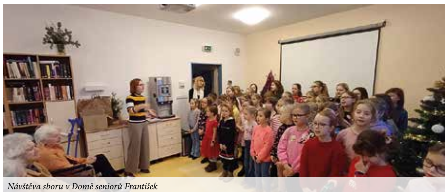
Návštěva sboru v Domě seniorů František