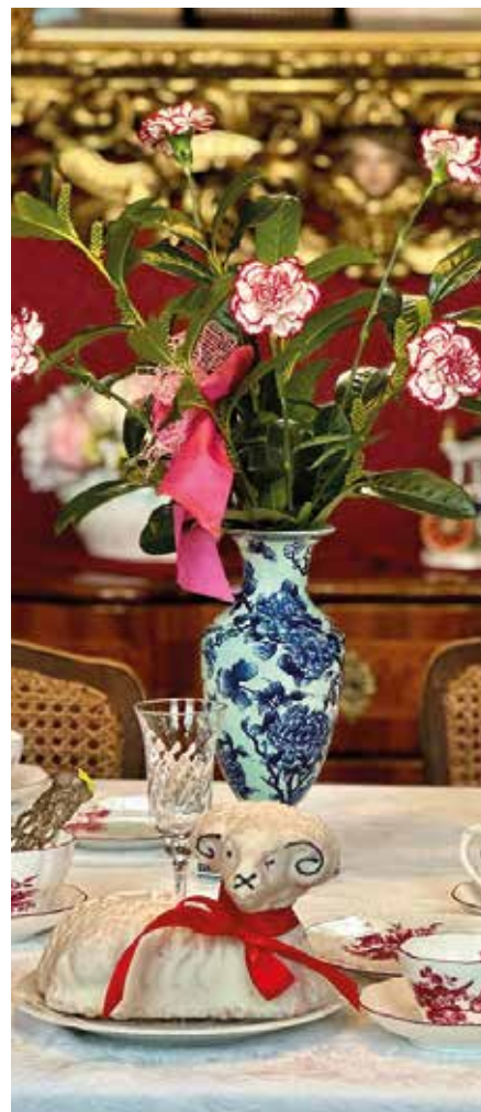
Červený salonek, reprezentační sály

I ve volném čase zůstává věrná svým zájmům. Ráda objevuje historické stavby, zajímá ji architektura a ráda aranžuje květiny. Mezi její oblíbené činnosti patří také četba dobré knihy, sledování filmu či cestování. I když se historii věnuje profesně, návštěvy hradů a zámků ji stále nepřestaly fascinovat.