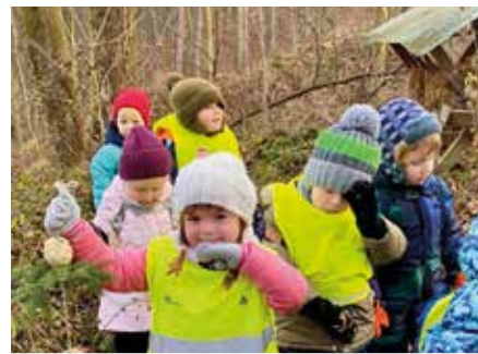
Berušky v lese pomáhají zvířátkům

duální podobě následně jednotlivé třídy oslavily Den stromů, Den zvířat a připravovaly záhonky na zimu. Starší děti měly možnost zpracovat hmotu z kompostéru, do něhož po celý rok odnáší biologický odpad