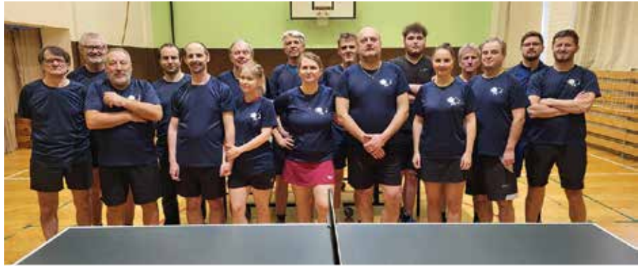
Stolní tenis Vánoční turnaj 2024