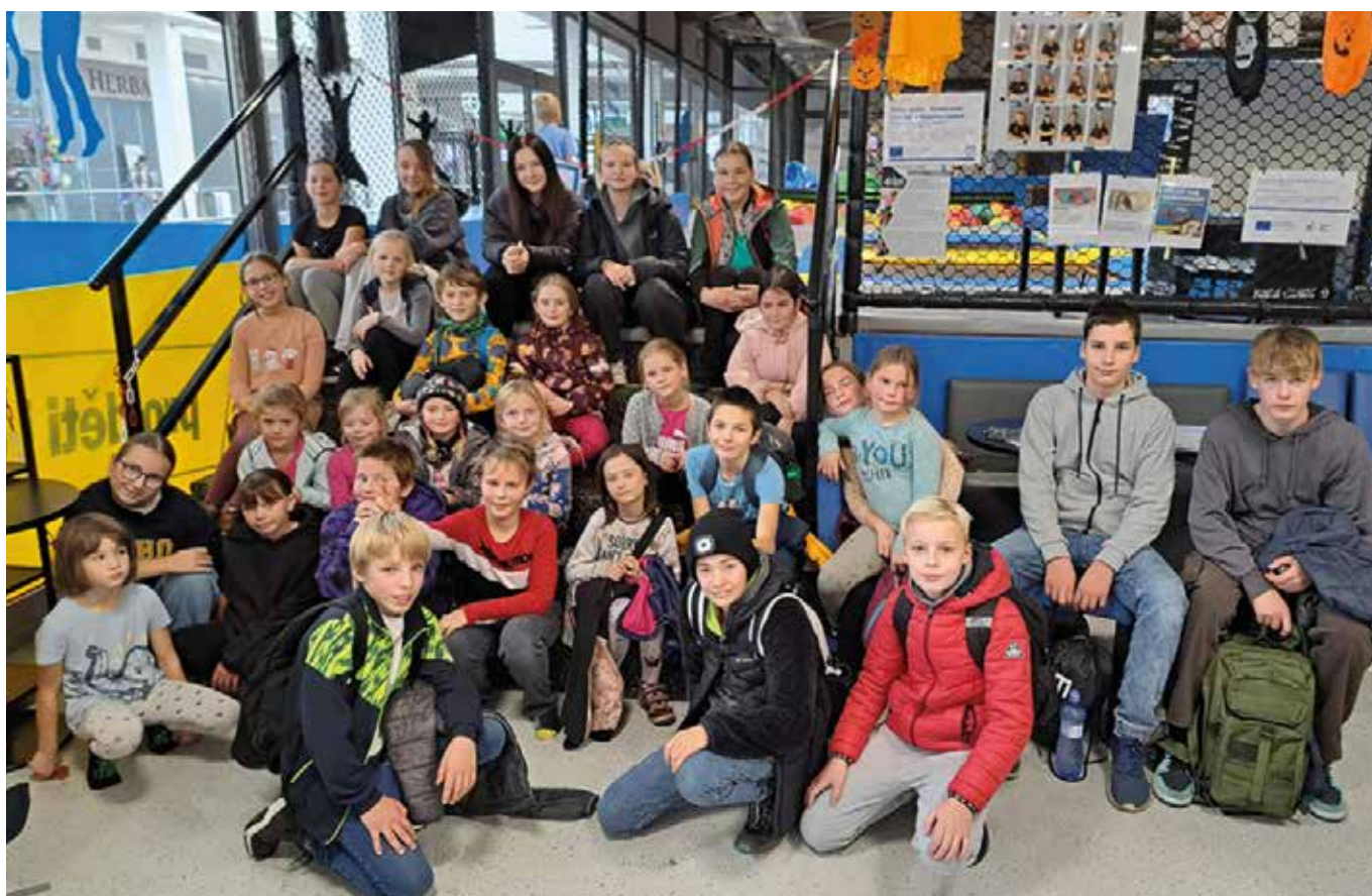
Jump Arena Olomouc