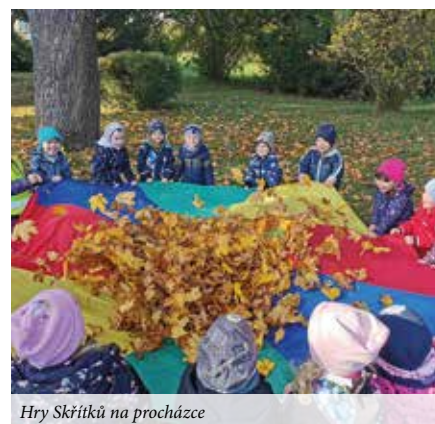
Hry Skřítků na procházce