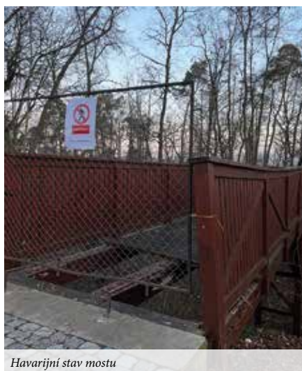
Havarijní stav mostu