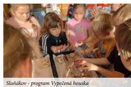
Sluňákov - program Vypečená houska