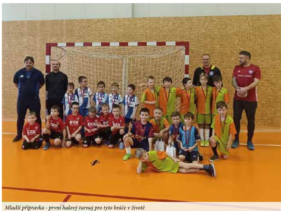
Mladší přípravka - první halový turnaj pro tyto hráče v životě

Muži skončili na podzim desátí ze 14 týmů v 1. A třídě skupina A se skóre 24:30. Hráči dostali krátké volno a pak získali individuální plán