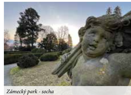
Zámecký park - socha