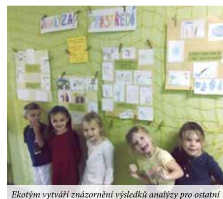
Ekotým vytváří znázornění výsledků analýzy pro ostatní