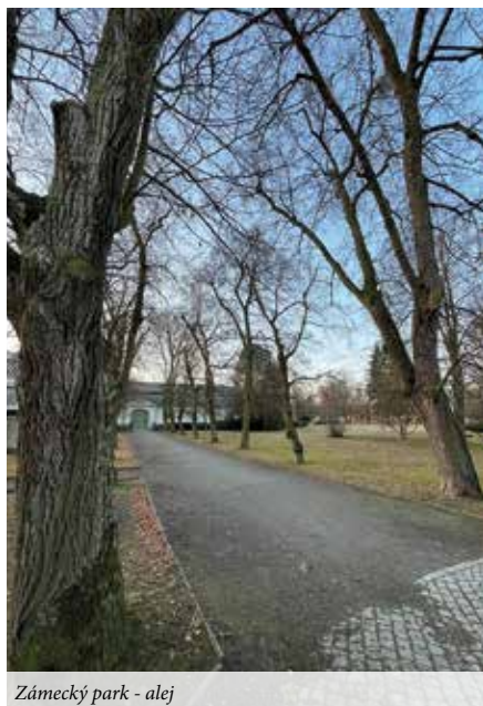
Zámecký park - alej