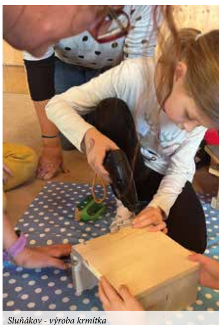
Sluňákov - výroba krmítka

K další oblíbené akci patří návštěvy Sluňákova, ekologického centra města Olomouce. Po podzimních exkurzích čtvrtáků a pátáků se v prosinci do Sluňákova vypravili také třetíci, kteří si v programu "Vypečená houska" vyzkoušeli celý proces výroby pečiva – od zrna až po voňavou upečenou pochoutku. Následně se na ekologický program vypravili i druháci, kteří spojili síly a s pomocí nejrůznějšího nářadí vyrobili krmítka pro ptáčky. S příchodem nového roku se do výroby pustili i prvňáčci, kteří si nejen osvojili manuální dovednosti, ale také si uvědomili důležitost pomoci ptactvu v zimních měsících.