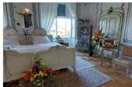
Velká ložnice, 1. patro zámku