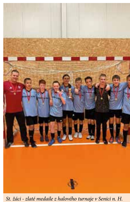
St. žáci - zlaté medaile z halového turnaje v Senici n. H.