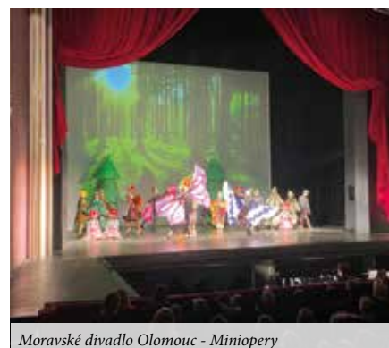
Moravské divadlo Olomouc - Miniopery

V rámci kulturního vzdělávání se žáci čtvrtých a pátých tříd naší školy vydali 21. listopadu 2024 do Reduty v Olomouci, aby si připomněli rok oslav narození Bedřicha Smetany – slavného skladatele, jehož hudba zní po celém světě. Moravská filharmonie spolu s mladými pěvci a studenty hudebních akademií připravila pestrý program zahrnující výběr z orchestrálních, operních, komorních i klavírních skladeb. Výkony hudebníků a sólistů okouzly malé i velké posluchače a přinesly jedinečný hudební zážitek.