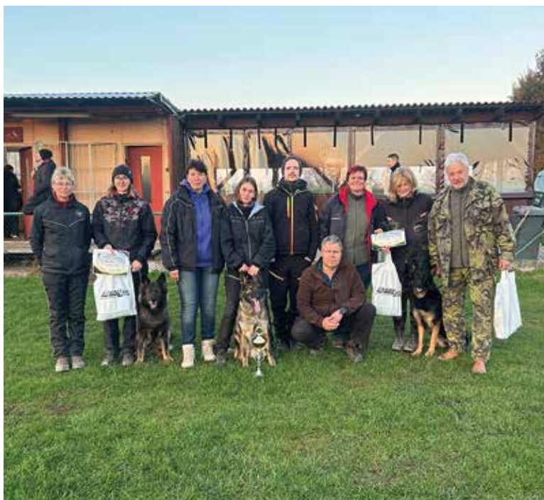
Meziklubový stopařský závod v Sudkově